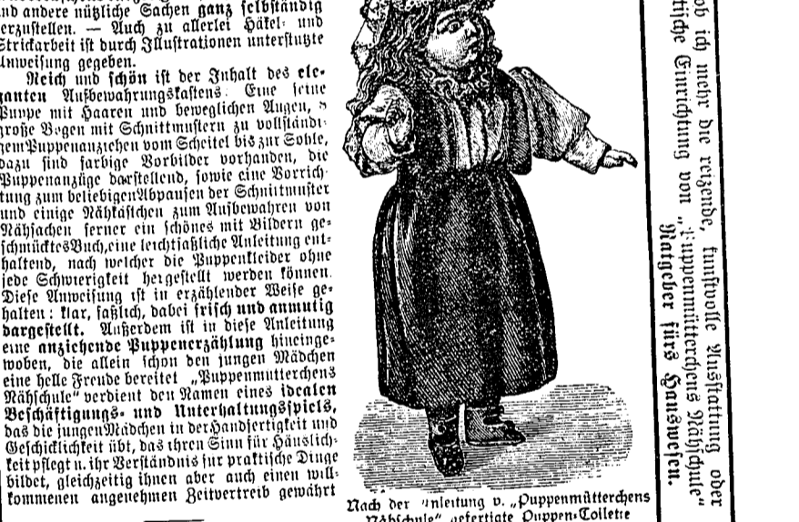
Das Buch „Anleitung u. Puppenmütterchens Nähschule“ neueste Puppen-Galerie.